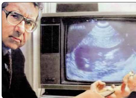
„Němý výkřik“ je otrásvající filmový dokument ukazující na ultrazvuku průběh potratu

Dalším prvkem jejich taktiky byla hra na tzv. katolickou kartu. Propotrátoví činitelé v jednom kuse napadali katolickou církev a její „zpátečnické“ postoje, přičemž