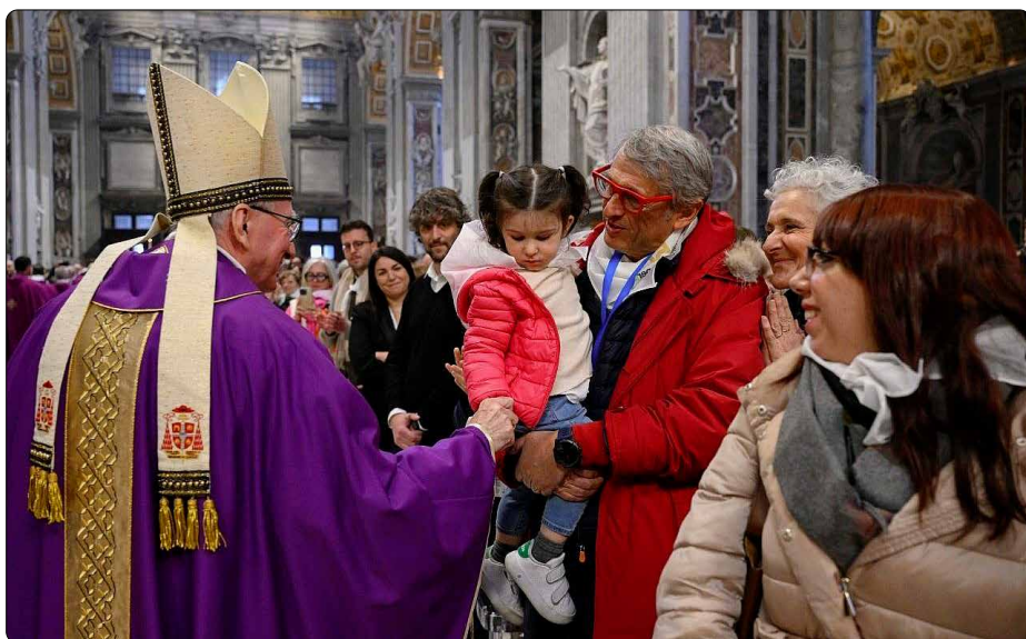
Mše k 50. výročí založení Hnutí pro život ve Vatikánské bazilice