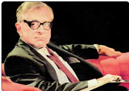
Profesor Bernard Nathanson, bývalý potratář

Bernardův otec, profesor-lékař a syn židovských emigrantů, se ještě jako student odvrátil od ortodoxního judaismu. V Boha nevěřil, věřil pouze v jakousi „vyšší sílu“. Právě on zanechal trvalou stopu na životě a osobnosti svého syna tím, že mu předal nihilistické postoje a přesvědčení. Chlapec vyrůstal v domácnosti, v níž se zvyky a obřady spjaté s židovskou vírou toliko uchovávaly, ovšem už nepraktikovaly. Rodiče vyslali svého syna do jedné z nejlepších škol v New Yorku (Columbia Grammar School), do které chodily děti z nejbohatších židovských rodin.