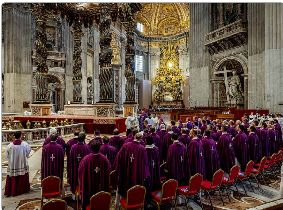
Mše svatá při národní pouti Jubilejního roku 29. března 2025, Svatopetrská bazilika v Římě

O tom všem psal starozákonní prorok Izaiáš a jeho slova četl Ježíš v nazaretské