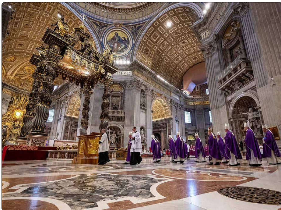
Mše svatá při národní pouti Jubilejního roku 29. března 2025, Svatopetrská bazilika v Římě

ší Syn Boží toto radostné poselství o tom, že i oni mají svou lidskou důstojnost jako všichni ostatní, že i oni jsou povoláni k radosti a stejně i jim patří Boží láska.