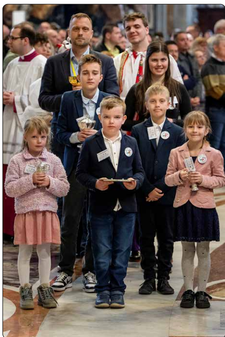
Mše svatá při národní pouti Jubilejního roku 29. března 2025, Svatopetrská bazilika v Římě

Ano, je to radostná zvěst, kterou Kristus přináší! A je-li tam řečeno, že je určena „chudým“, pak se můžeme ptát: Kdo jsou ti chudí? Pochopitelně jsou to ti v doslovném slova smyslu; ti, kdo nemají nikde a u nikoho oporu, kdo jsou v tomto světě bezbranní a pro které neexistuje žádné dobré slovo. Jim především přiná-