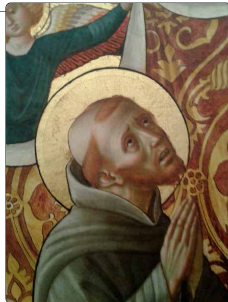
Blahoslavený Jiljí z Assisi

Později, asi roku 1226, jej sv. František poslal do poustevny ve Fabriano u Perugia, kde Jiljí všechen svůj volný čas strávil kontemplací. Doznával zde dokonce