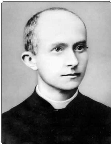
Arnold Janssen jako mladý kněz a učitel v Bocholtu roku 1865

A rnold Janssen se narodil 5. listopadu 1837 v malém městečku Goch na dolním Rýnu nedaleko holandských hranic. Z jedenácti dětí byl druhým dítětem hluboce věřících rodičů. Otec, prostý povozník a zemědělec, kladl velký důraz na dobrou křesťanskou výchovu svých dětí. Mnohé z otcových charakteristických rysů se později projevily i u Arnolda: disciplína, neúnavná pracovitost, hluboká zbožnost, výjimečná úcta k Duchu Svatému a zvláštní láska ke sv. Janu Evangelistovi, na jehož svátek se Arnoldův otec narodil.