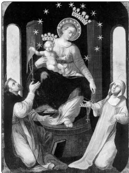
Obraz Panny Marie Růžencové z Pompejí

Je to svobodný úřadek Boží prozřetelnosti. Bůh nám nemusel dát svou milost tímto způsobem, ale velmi vhodně a moudře se rozhodl, že nám ji dá skrže lidství Ježíše Krista a skrže Pannu Marii. A jak zdůrazňoval papež Lev XIII., modlitba růžence tento úřadek božské prozřetelnosti respektuje a zachovává.