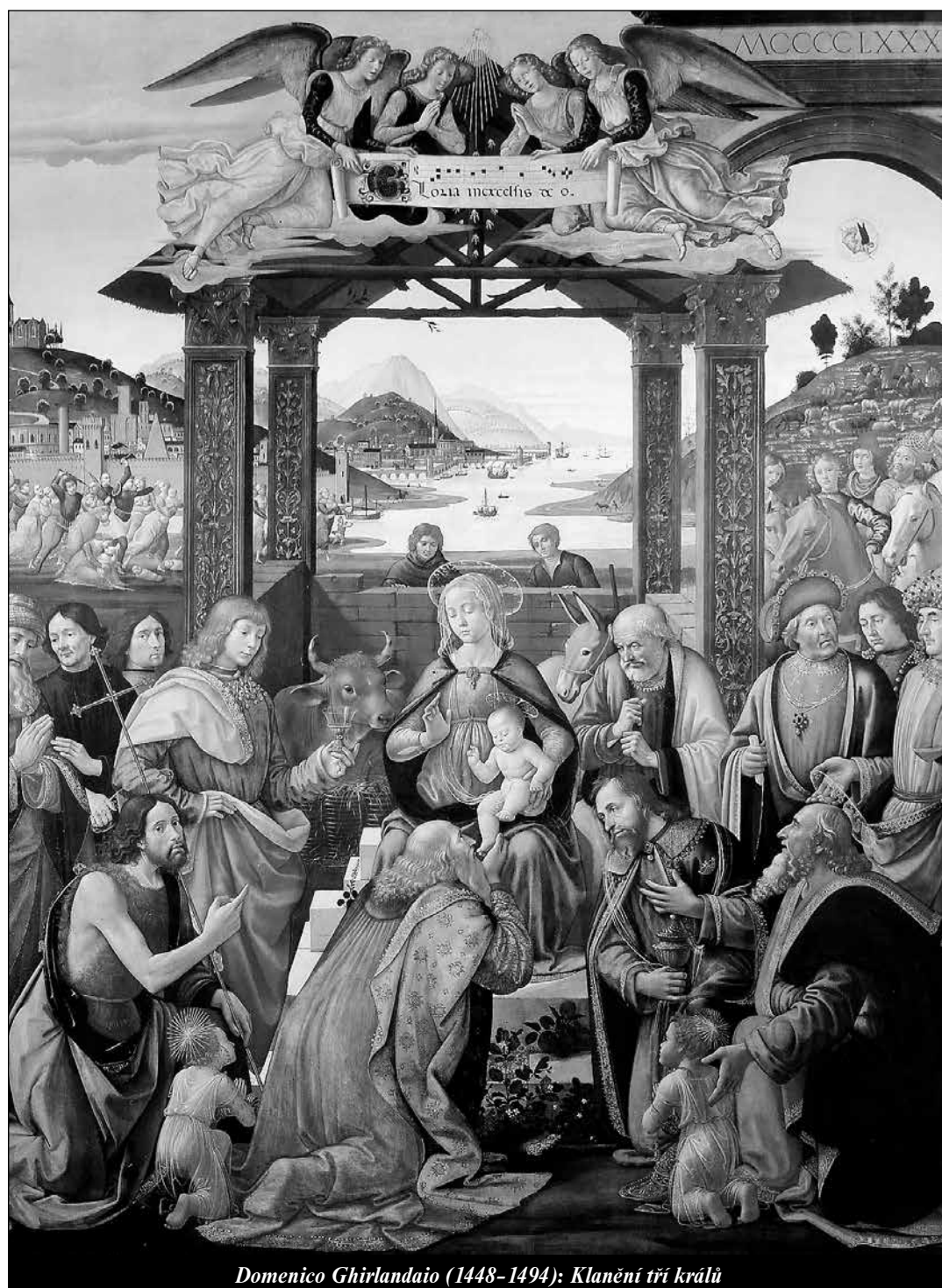
Domenico Ghirlandaio (1448–1494): Klanění tří králů