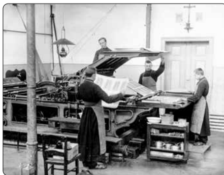
Počátky misijní tiskárny

Jeho povoláním mělo být: pracovat v domovině pro světové misie – modlitbou, psaním, vyprávěním příběhů, sbíráním prostředků, organizováním a vedením... – a on na to všechno řekl své ano. Ačkoli se mu mnozí vysmívali, on zůstal klidný a pevně odhodlaný; a to dokonce i tehdy, kdy si od kolínského arcibiskupa musel vyslechnout: „Žijeme v době, kdy se všechno otřásá a hroustí, a vy si tu přijdete a chcete začít něco nového?“