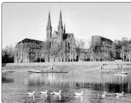
Misijní dům sv. Michala ve Steylu

Janssen narážel všude jen na odmítnutí. On sám se však nevzdával, postil se a modlil, dokud nebyl vyslyšen – i když jinak, než očekával. „Založte misijní dům sám,“ radil mu Mons. Raimondi, apo-