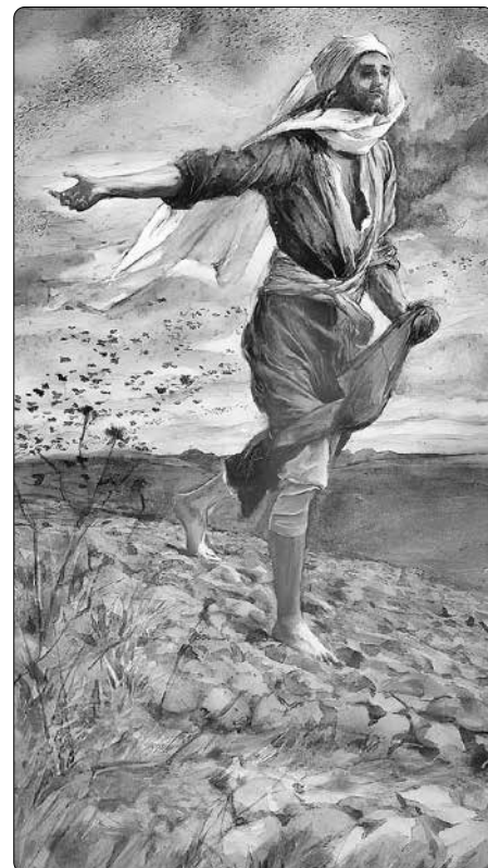
James Tissot (1836–1902): Rozséváč

Boha, jedině křesťanské náboženství má jedinečný „nárok“ na pravdu a univerzálnost. Justin našel smysl svého života. Ve věku 30 let se dal pokřtít a za svůj cíl si stanovil ohlašovat radostnou zvěst židům i pohanům.