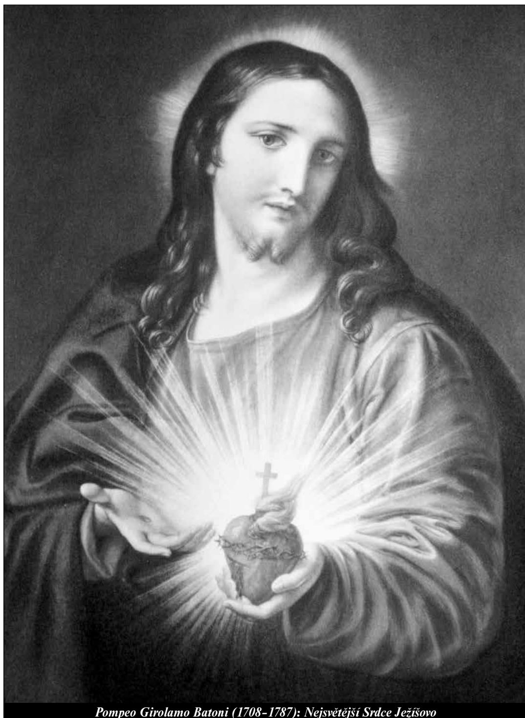
Pompeo Girolamo Batoni (1708–1787): Nejsvětější Srdce Ježíšovo