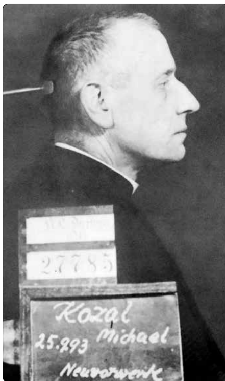
Fotografie biskupa Michala Kozala po jeho zatčení gestapem

Biskupskou autoritu vězně č. 24544 pozorovali i dozorcí a hledali způsob, jak se nepokořeného, přitom však pokorného kněze zbavit. Vzhledem k tomu, že byl biskupem, varovali se to udělat osvědčeným způsobem. Do karet jim nahrála epidemie tyfu, která na přelomu let 1942/1943 tábor napadla.