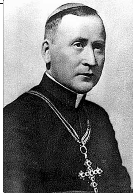
Blahoslavený biskup Michal Kozal