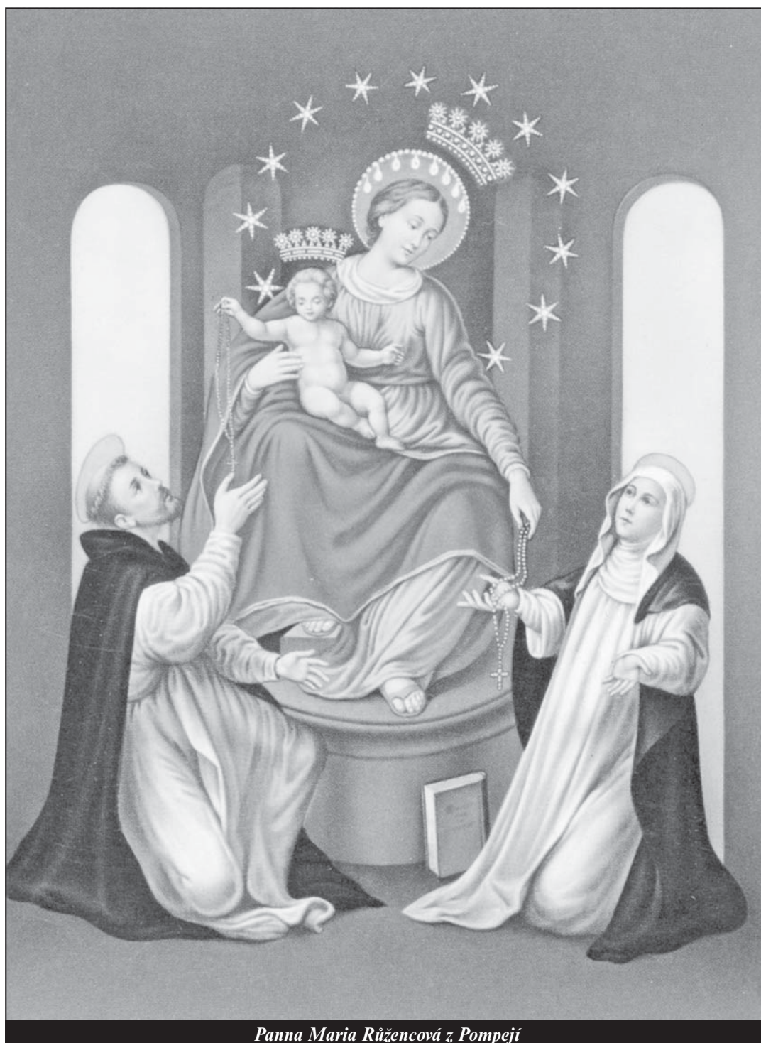
Panna Maria Růžencová z Pompejí