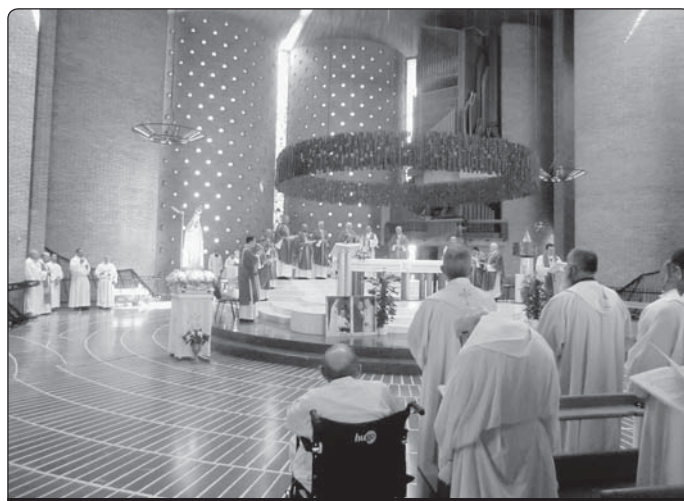
Duchovní cvičení Mariánského kněžského hnutí v Collevalenza, červen 2012