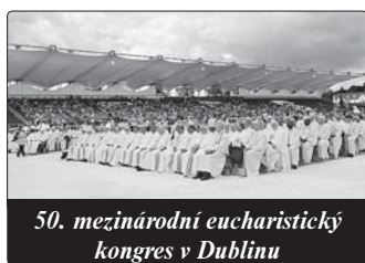
50. mezinárodní eucharistický kongres v Dublinu

Překonat tuto formu křesťanství a prožívat opět víru jako hluboké osobní přátelství s dobrotou Ježíše Krista bylo nejlépe řečeno úkolem Koncilu. I eucharistický kongres slouží tomuto cíli. Chceme se zde setkávat se zmrtných vstalým Pánem. Prosíme ho, aby