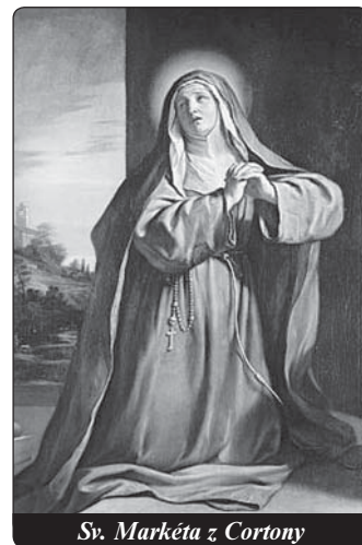
Sv. Markéta z Cortony

Markéta pociťuje silnou potřebu pokání a odčinění hříchů a činí tak často gesty velmi nápadnými, stále více strohým pokáním, přísností v půstu, v odivání, v řeči, v ustavičném nářku, ve vyhledávání tělesného utrpení. To všechno může podněcovat naši citlivost a pociťujeme, že svěťice je příliš vzdálená od naší každodenní cesty, že je pro nás nedostupná ve své strohosti. Jistě, překračovala to, co se požadovalo od terciářky v oné době, ale napodobovat ji neznamená opakovat její gesta, nýbrž přijmout ducha, který ji oživoval. Markéta se stala zcela bezvýhradnou ve svém obrácení a její skutky byly skutky té, která se zcela zamilovala v Bohu a v postupném přijímání lásky, s jakou On nám daroval sám sebe. Pokání je pro ni nezbytností lásky, je autentické, protože