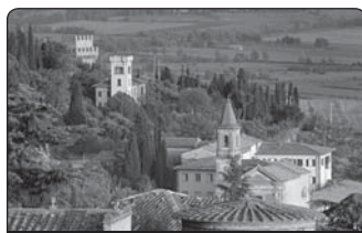
Cortona, město v italském Toskánsku, v provincii Arezzo

Nezbytnost následování přivede Markétu k poslušnosti vůči Kristu, když bude uvedena na cestu, kterou jí určí: „Moje ubohá Markéto, od nynějška už nemáš chodit po Cortoně sbírat almužny, ale aniž bys změnila itinerář, jdi přímo do kostela k bratřím naslouchat mším a kázáním, protože jim jsem svěřil tebe: jim jsem uložil, aby o tebe pečovali.“ (II, 5) Tentýž Ježíš je jejím vnitřním učitelem: „Stal jsem se tvým vůdcem na cestě, něžně jsem tě vyvedl z nejhlubší propasti světa a tvých ubohostí. Mně vděčíš za počátek svého obrácení.“ (II, 9)