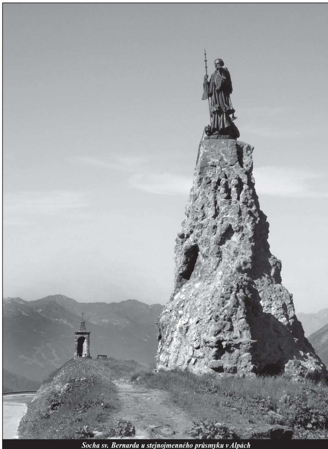
Socha sv. Bernarda u stejnojmenného průsmyku v Alpách