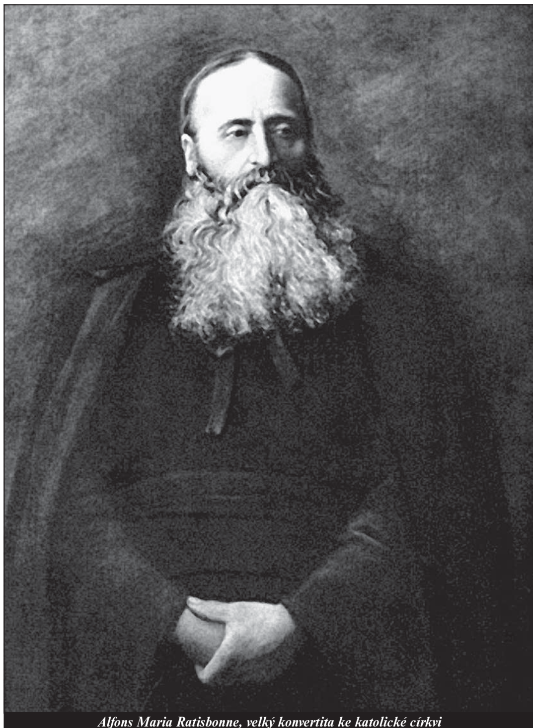
Alfons Maria Ratisbonne, velký konvertita ke katolické církvi