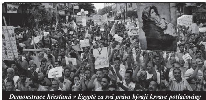
Demonstrace křesťanů v Egyptě za svá práva bývají krvavě potlačovány

Když Arabové vtrhli v 7. století do Egypta, byli nejdříve křesťany vítáni. Nacházeli se totiž v konfliktu s Byzancí. Brzy však byli degradováni na lidi druhé třídy a potlačováni. Tvořili nicméně většinu až do 13. století. Za vlády Fatimidů a později za Saladina prožívali relativní autonomii. Pod mameluky (1250–1517) byli opět utiskováni. Teprve v 19. století zažili renesanci, když vládce Mehmet Ali stál v boji proti fanatickým vabitům ze Saúdské Arábie. Západní vlivy koptům přály. V některých obdobích tvořili polovinu parlamentu a Butrus Ghálí, dědeček pozdějšího generálního tajemníka OSN, byl dokonce ministerským předsedou monarchie. Roku 1910 byl zavražděn fanatickým muslimem. Do doby jeho vlády spadá založení katolického koptického patriarchátu. Za patriarchy Kyrilla VI. (1959–1971) a za Shenudy III. (od 1971) prožili koptové vnitřní obnovu i uprostřed radikalizujícího se islámu. Diskriminace pokračovala za Násira. Ale i Mubarak, který podporoval islamisty, měl ještě dva koptické ministry.