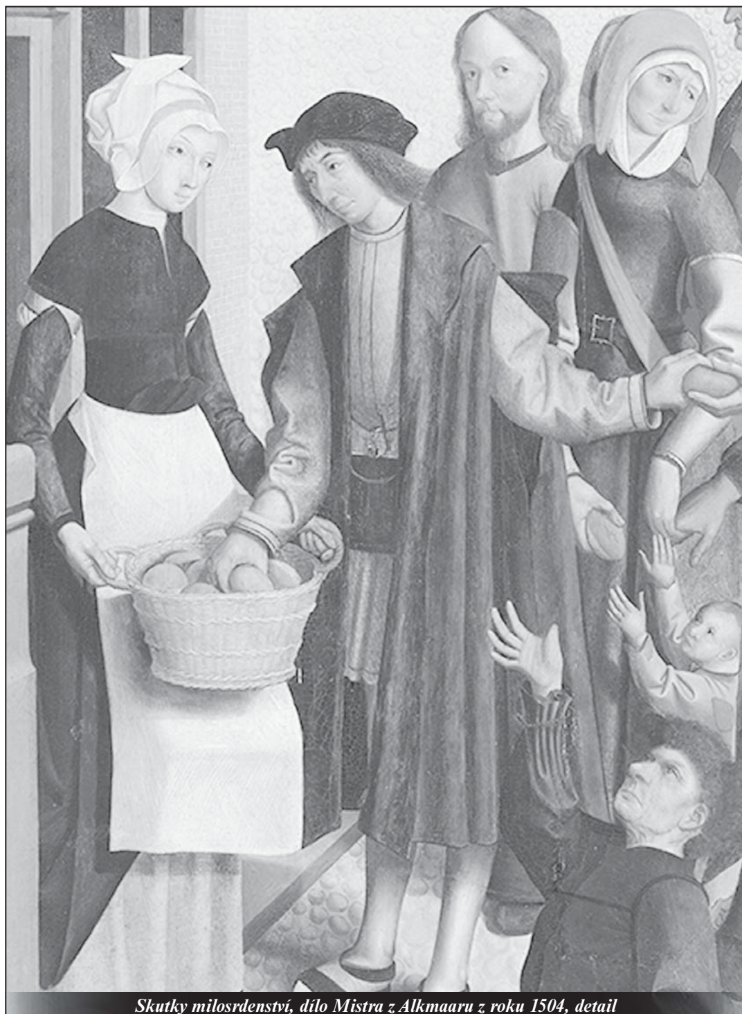
Skutky milosrdenství, dílo Mistra z Alkmaaru z roku 1504, detail

Dokument o neporušitelnosti svátostného zpovědního tajemství - strana 13 -