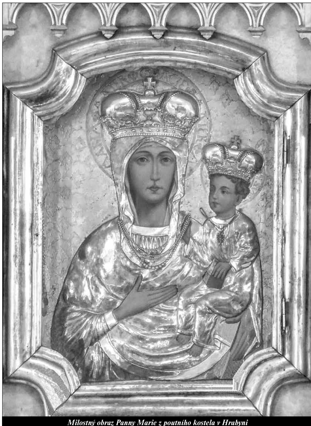
Milostný obraz Panny Marie z poutního kostela v Hrabyni