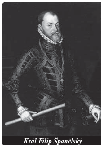
Král Filip Španělský

Historie devatenácti mučedníků z Gorkum je jen jednou kapitolou z tragických událostí oné doby, ale patří k těm nejstrašnějším a nejdojemnějším. 26. června 1572 dobyli protestanti městečko Gorkum. Při