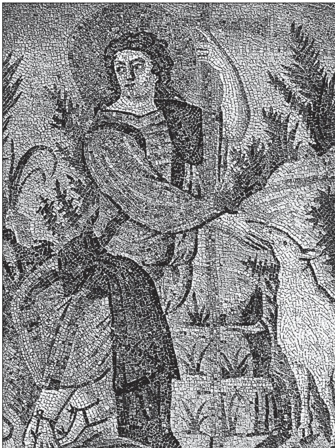
Mozaika Dobrého Pastýře z mauzolea Gally Placidie, manželky císaře Constantia III., Ravenna (5. stol)