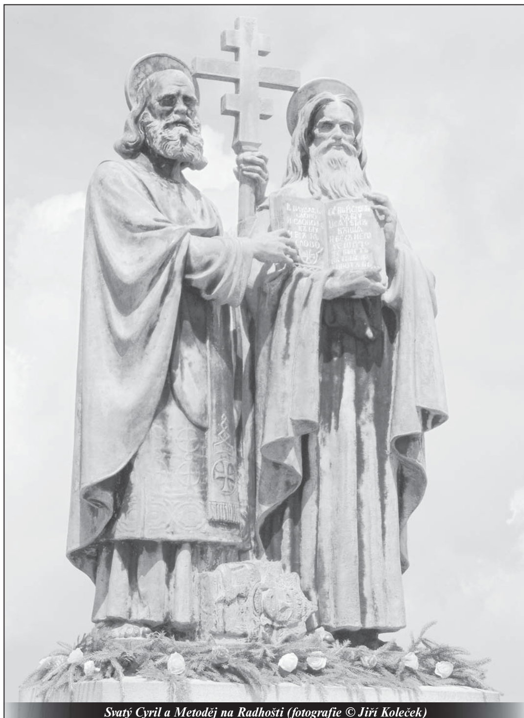
Svatý Cyril a Metoděj na Radhošti

Tajemství zjevení v Tre Fontane (61) - strana 13 -