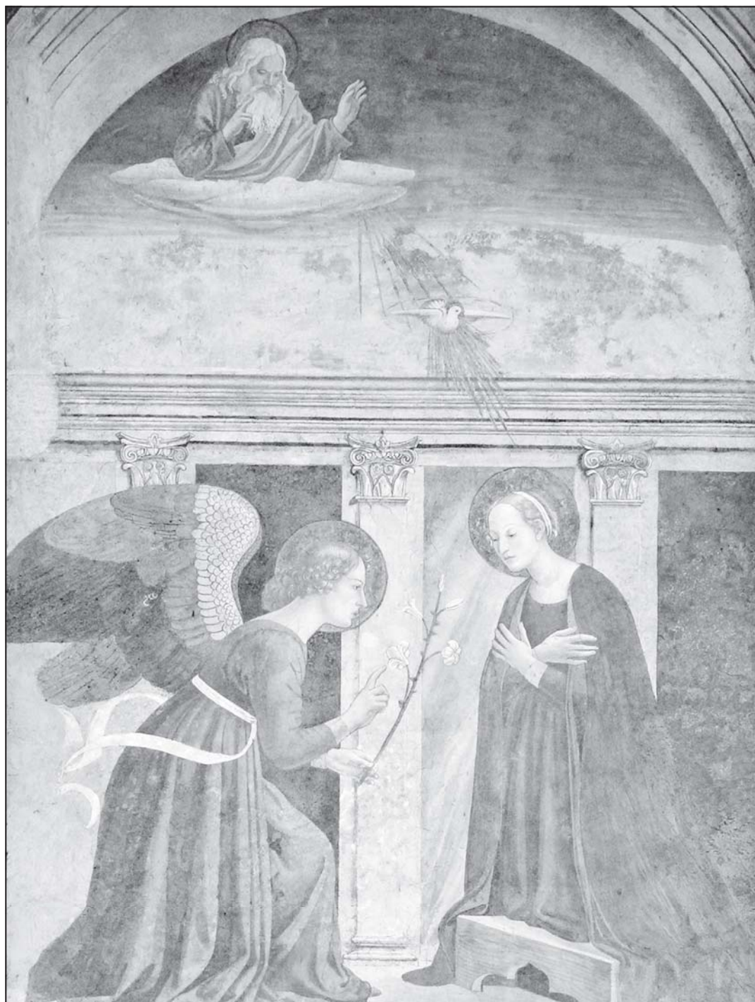
Melozzo da Forlì (1438-1494): Zvěstování