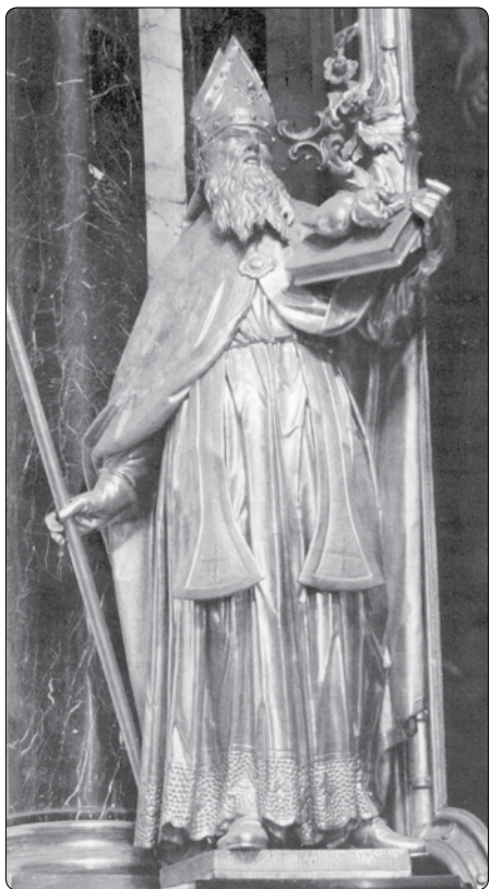
Aurelius Augustinus (354–430)

Pro Augustina je Bůh absolutní dobro. A kdo se přikloní k absolutnímu dobru, ten bude šťasten. Tento výrok je zajímavý právě také pro naši dobu. Existuje tolik jiných „bohů“, jimž dávají dnešní lidé