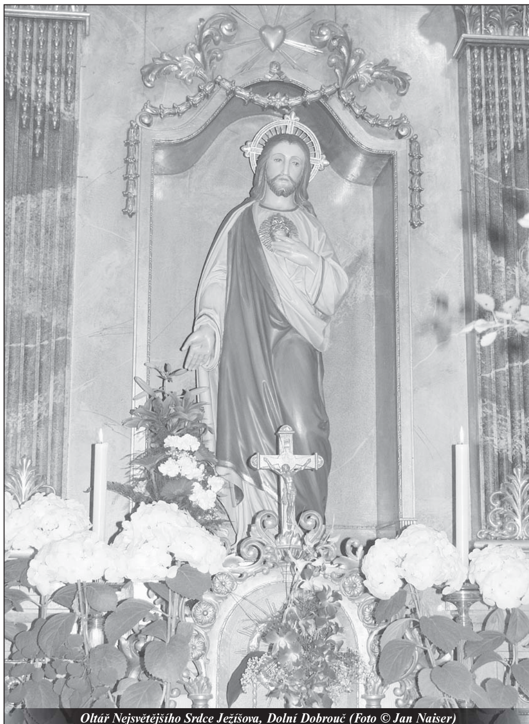
Oltář Nejsvětějšího Srdce Ježíšova, Dolní Dobrouč

Tajemství zjevení v Tre Fontane (60) - strana 13 -