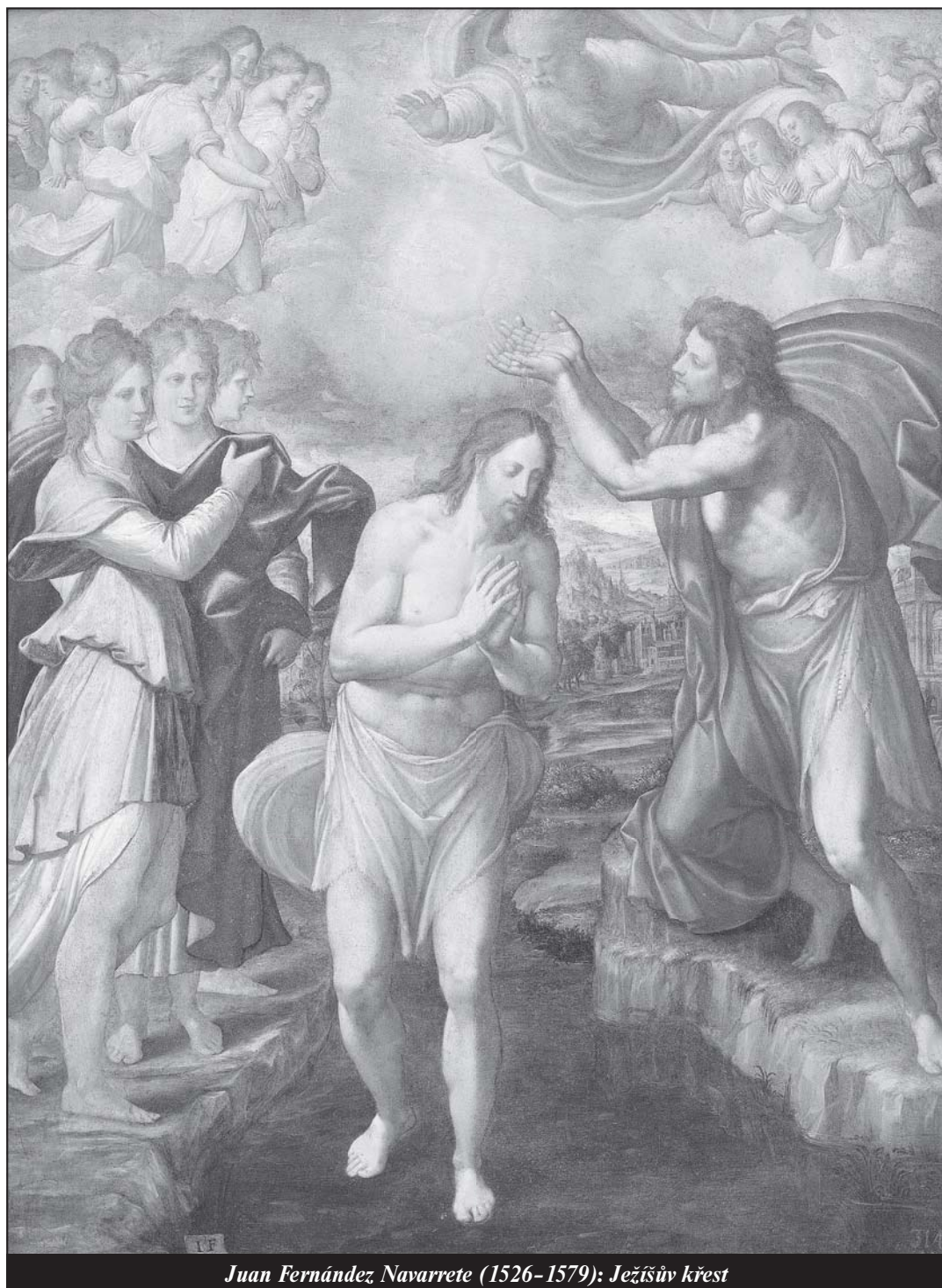
Juan Fernández Navarrete (1526-1579): Ježíšův křest

Sv. Alfons Maria de Liguori - strana 12 -