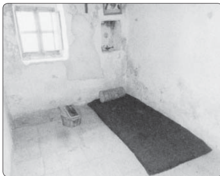
Cela v poustevně, v níž žil sv. Šarbel

případech, které jsou P. Luisem Matarem pečlivě zaznamenány, patří příjemci těchto nebeských milostí k různým náboženstvím. Úcta ke sv. Šarbelovi pochází buďto od samotných nemocných, nebo od někoho z jejich blízkého okolí.