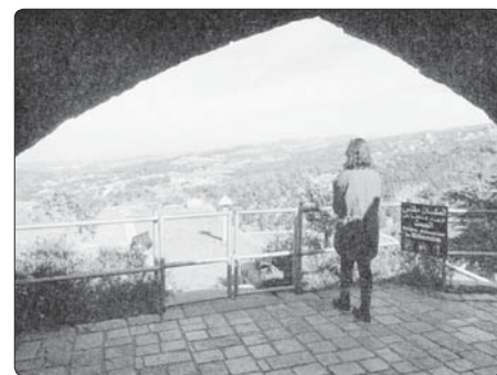
Pohled z terasy poustevny v Annayi

Když se dnes podíváme na situaci současného Blízkého východu, co vidíme? Vůdce, kteří obětovali svůj národ, aby si udrželi svoje místo a svůj trůn! Kde je jejich láska ke Kristu a k Orientu? Blízký východ je Bohem opuštěný, protože se vzdálil od hodnot lásky a věnoval se