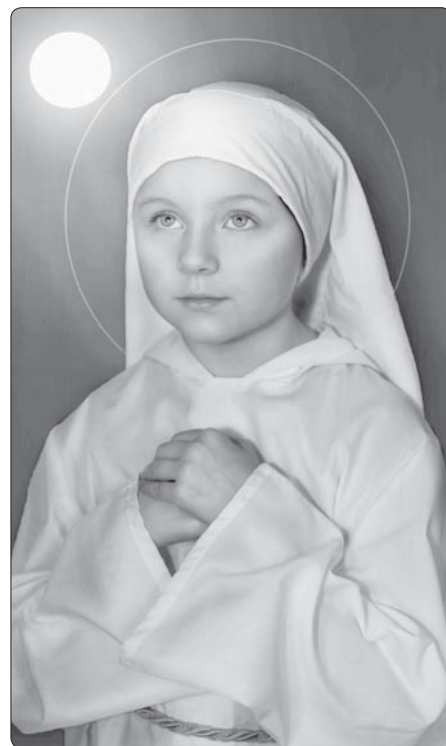
Bl. Imelda Lambertiniová

la klečet v chórové lavici. Ve své bezmoci a touze se otrásala tichým pláčem z pocitu nenasycení Kristem Ježíšem a se staže-