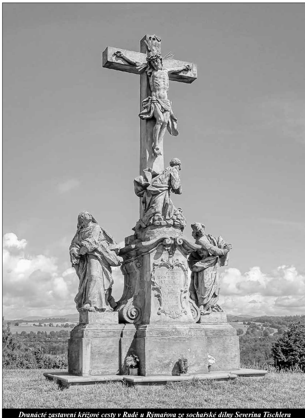
Dvanácté zastavení křížové cesty v Rudě u Rýmařova ze sochařské dílny Severina Tischlera