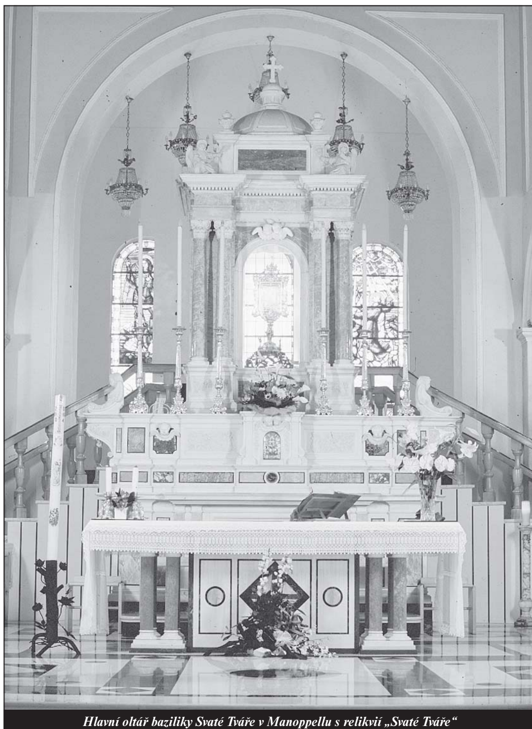
Hlavní oltář baziliky Svaté Tváře v Manoppellu s relikvií „Svaté Tváře“