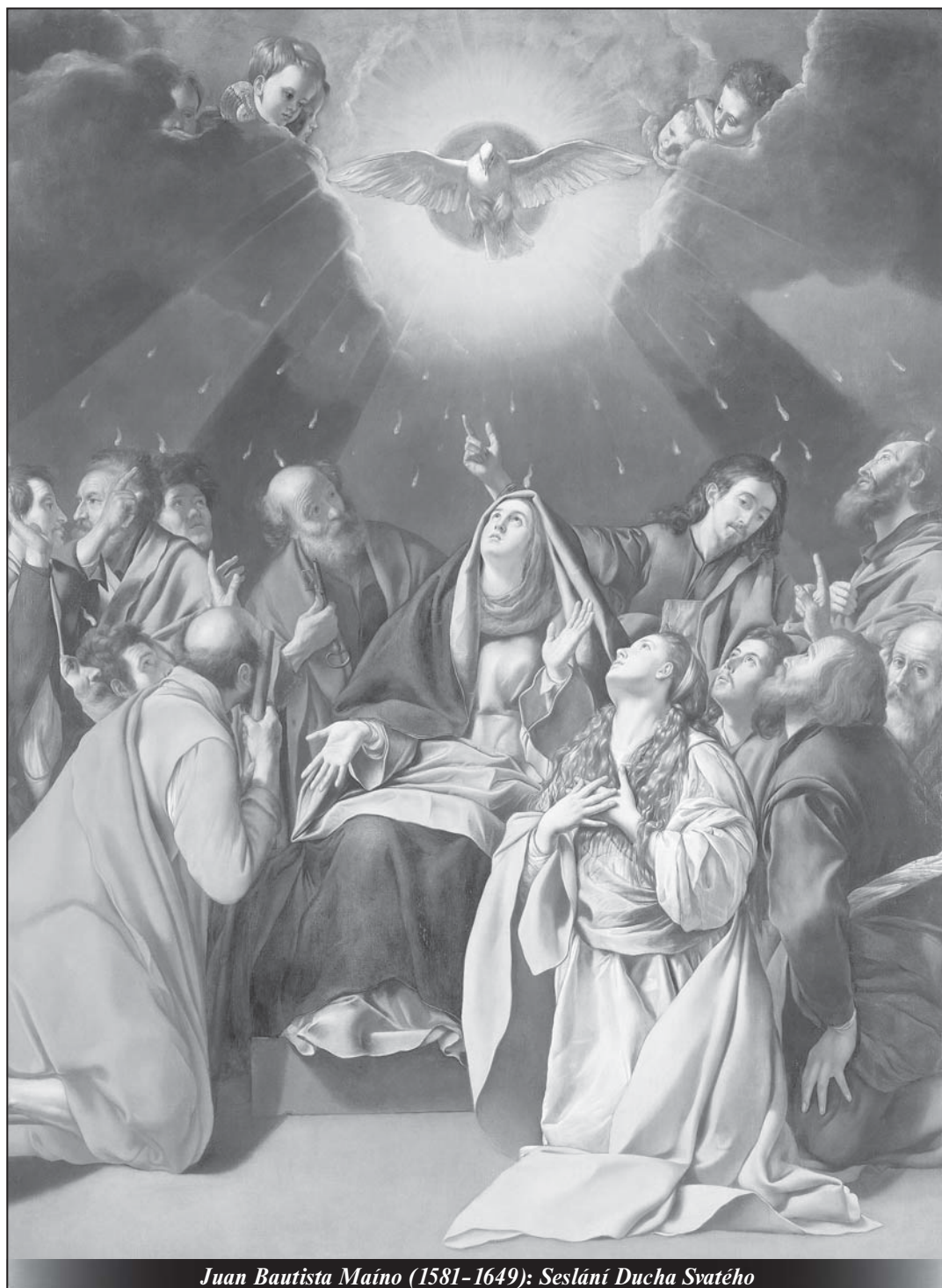
Juan Bautista Maíno (1581-1649): Seslání Ducha Svatého

Vizionář: Tajemství zjevení v Tre Fontane (58) - strana 13 -