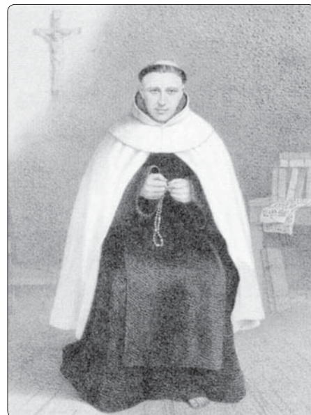
Augustin Heřman Cohen (Dobová fotografie z roku 1850)

Dne 28. srpna téhož roku 1847 přijal Heřman Cohen křest v kapli Naší Milé Panny ze Sionu. O deset dní později, o svátku Narození Panny Marie, jde nově pokřtěný, který se teď jmenuje Augustin,