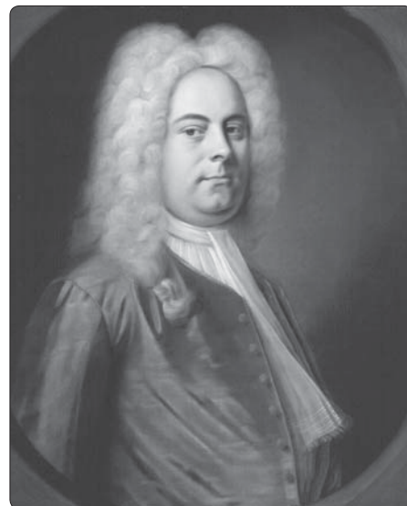
Georg Friedrich Händel

Vesmír, největší mistrovské dílo umělecké tvorby, vzešel ze Stvořitelovy lásky. Proto každý, kdo s otevřeným srdcem pozoruje stvoření, pocítuje něco z této tvořivé lásky našeho Boha. Podobně je to i s posluchači „Mesiáše“, jednoho z nejznámějších barokních oratorií. Kdo by necítil něco z velikonočního jásotu, když uslyší sborové „Aleluja“, anebo nepocítil lásku Dobrého pastýře při duetu „Bude pást své stádo jako pastýř“? Je důležité, abychom věděli, že milostivý účinek tohoto díla je plodem hlubokého utrpení.