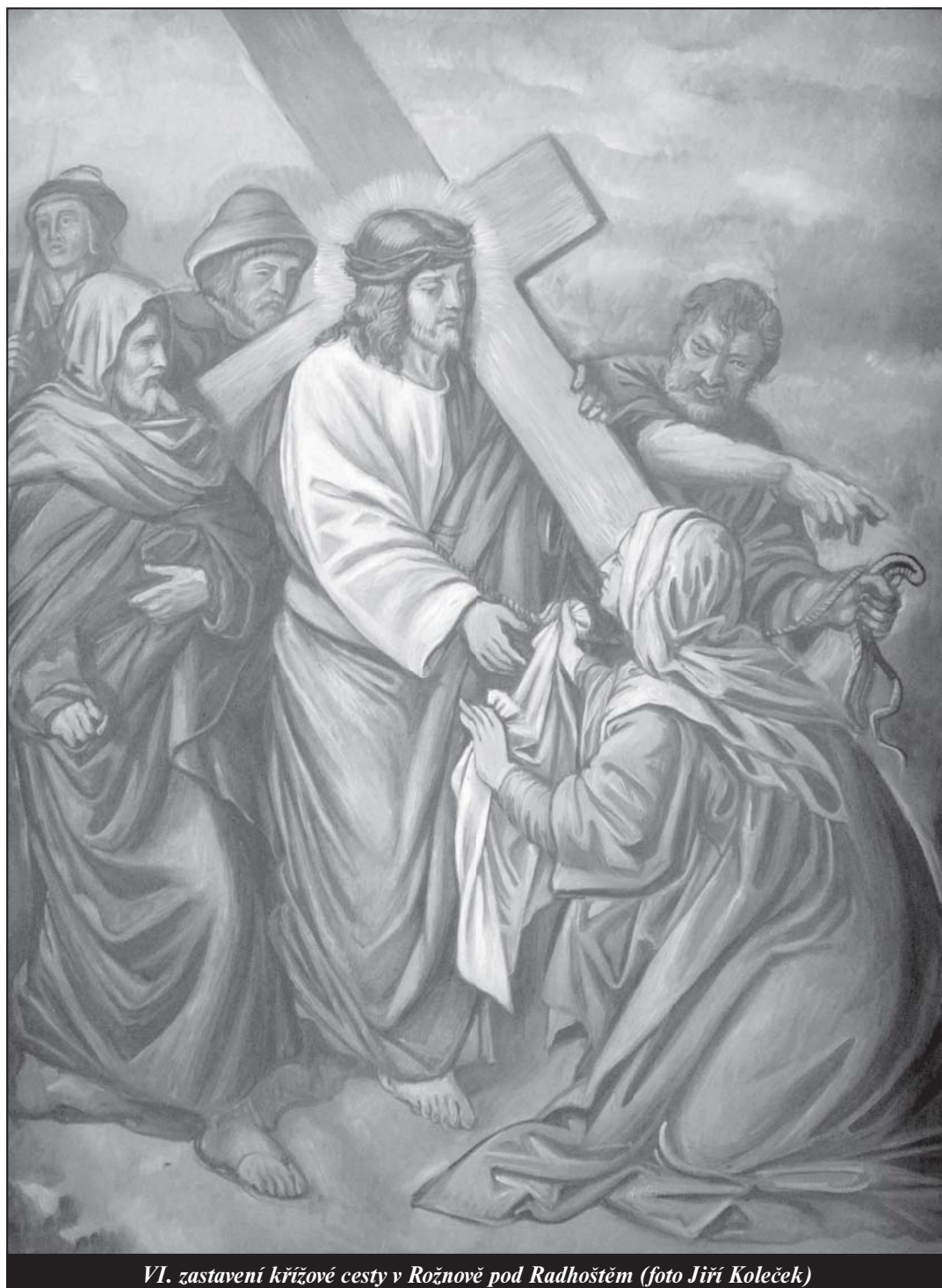
VI. zastavení křížové cesty v Rožnově pod Radhoštěm

Tajemství zjevení v Tre Fontane (47) Saverio Gaeta - strana 13 -