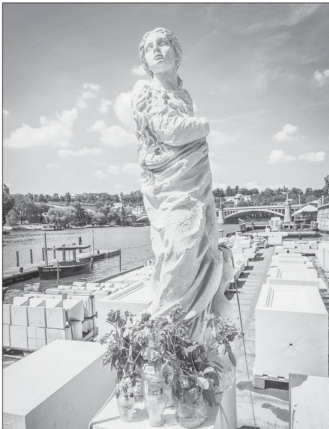
Kopie torza sochy Panny Marie s dokončenými stavebními díly mariánského sloupu, umístěné na lodi kotvíci pod klášterem křižovníků u Karlova mostu.