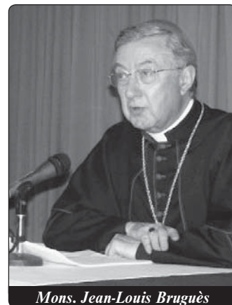
Mons. Jean-Louis Bruguès

To obsahuje požadavek, aby vyučující a vychovatelé upustili od takové počáteční formace, která je poznamenána kritickým duchem, jak tomu bylo v mé generaci, pro kterou objev Bible a nauky byl kontaminován duchem systematické kritiky a také pokusem k unáhlené specializaci: a to právě proto, že této mládeži chybí nezbytný kulturní základ. Dovolte mi, abych uvedl několik otázek, které mě v této chvíli napadají. Je tisíc důvodů pro to, aby budoucí kněží obdrželi kompletní formaci na vysoké úrovni. Jako pozorná matka touží církev po co nejlepší budoucnosti svých kněží. Z toho důvodu jsou však kurzy přetížené programy, což se mi jeví přehnané. Jistě jste pochopili riziko, že mnozí vaši seminaristé ztratí odvahu. Tážu se: Je encyklopedická perspektiva přiměřená těmto mladým mužům, kteří nepřijali žádnou základní křesťanskou formaci? Nevyvolala tato perspektiva rozdrobení formace a kumulaci kurzů? Je třeba, aby se mladí lidé, kteří nezna-