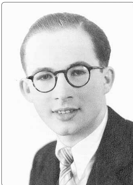
Bl. Marcel Callo