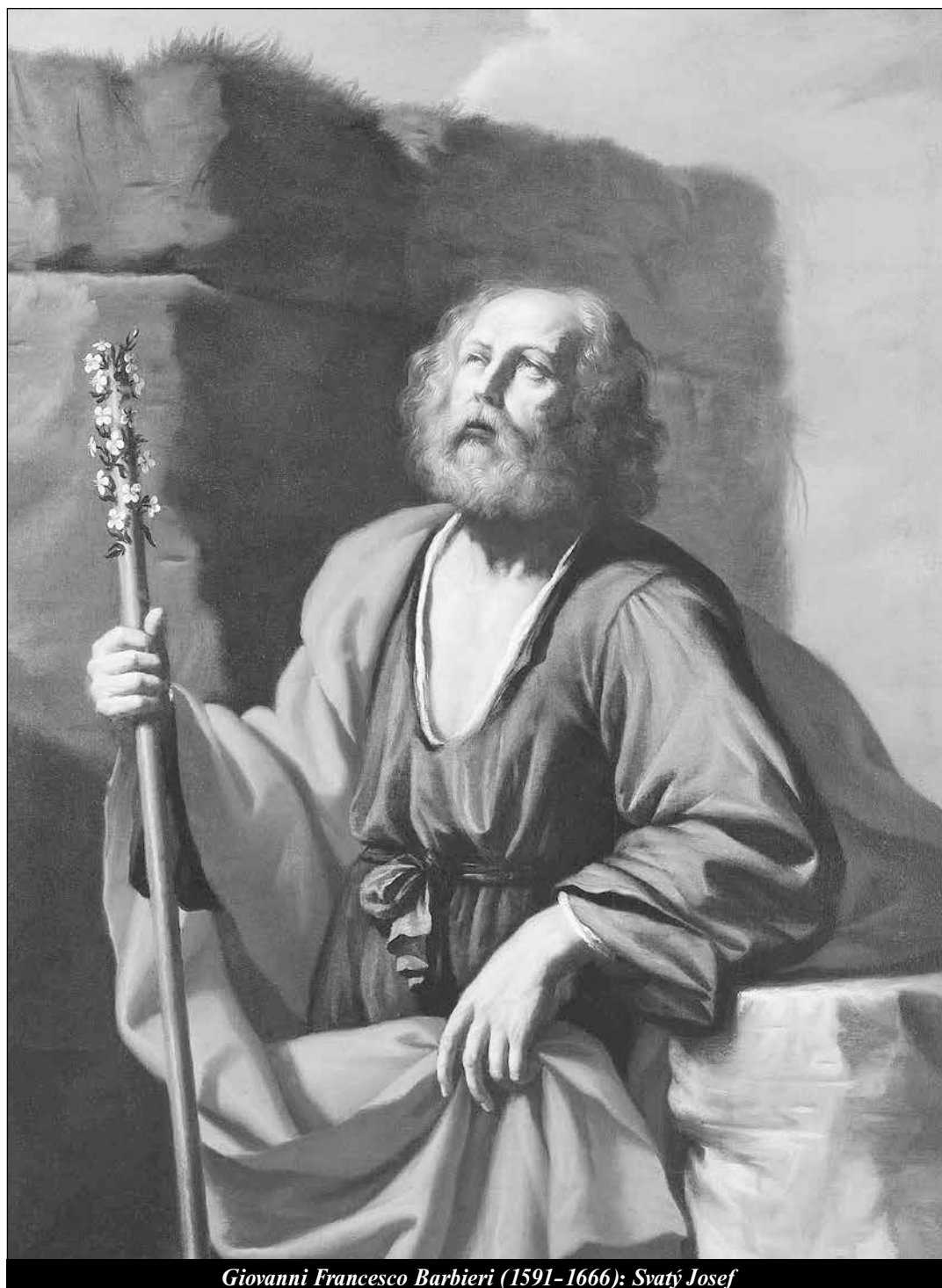
Giovanni Francesco Barbieri (1591-1666): Svatý Josef

Omezení lidských práv pouze v případě naprosté nutnosti - strana 13 -