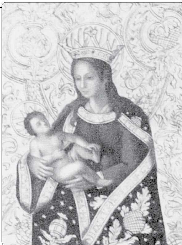
Milostný obraz Notre-Dame de Bonne Nouvelle

Na závěr římských slavností přijal papež 5. října asi 1000 francouzských poutníků v mimořádné audienci. Byli pozváni také němečtí a rakouští účastníci. Papež je vyzval: „Nechte se proniknout pavlovskou a mariánskou spiritualitou, které proměnily Marcelův život... Posilujte také svá osobní a společná pouta s Matkou Boží! Po celý svůj život byl Marcel Callo současně dítětem Naší Milé Paní Dobré zprávy, jejíž v roce 1908 korunovaný milostný obraz se uctívá od 15. století v Rennes a ještě stále přitahuje v bazilice St. Aubin ctitele. Marcel nikdy nestudoval mariánskou teologii, ale výchova, kterou dostal od své matky a ve své farnosti, ho přivedla k pravé mariánské zbožnosti katolické církve. Vyhradil Svaté Panně mimořádné postavení až do posledních okamžiků svého pozemského života. Božské mateřství Mariino a její podíl na vzniku a růstu církve nebyla pro něho pouhá slova. Oprav-