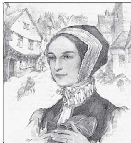
Svatá Markéta Wardová

ke stropu, až se země dotýkala pouze ko- nečky prstů nohou, a hlava nehlava ji bi- čovali. Markéta chvílemi ztrácela vědomí, ke konci ji díky trvalé nepřírozené polo- ze a nepřetržitému bití postihlo částečné