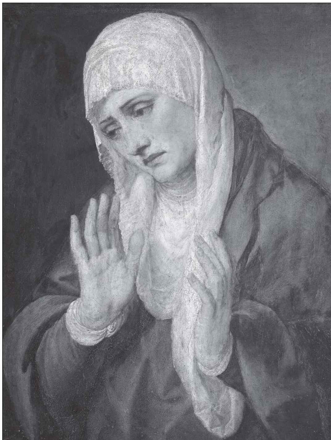
Tiziano Vecellio (1488-1576): Mater Dolorosa

Nejvyšší soud potvrdil propuštění Asie Bibi - strana 13 -